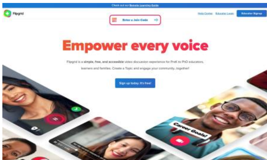
2 - Flipgrid