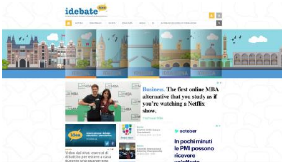
1 - International debate education association